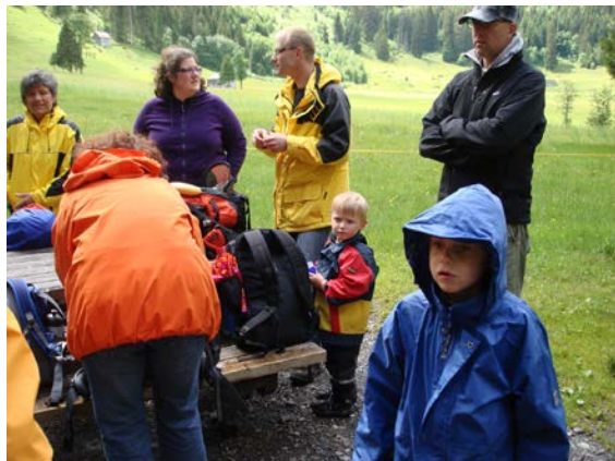
Chlauhelfer stellen Wettertauglichkeit unter Beweis

Schon beim Treffpunkt in Wildhaus waren Regenschirme und -jacken Pflicht und ein Blick in Richtung Berge liess auch keine Hoffnung auf Wetterbesserung für den Nachmittag aufkommen. Trotzdem waren alle gutgelaunt und nach einer kurzen Begrüssungsrunde fuhren wir im Konvoi hinauf ins Oberdorf.